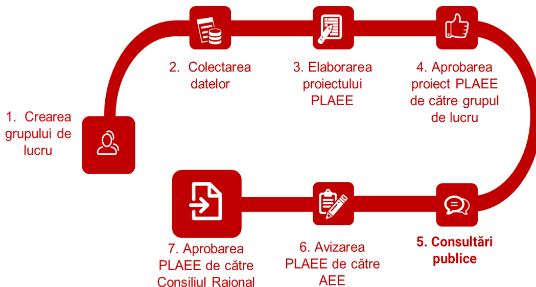
Figura 1. Abordarea aplicată planificării în sectorul de eficiență energetică

Exercițiul de planificare strategică aplicat sectorului eficienței energetice a fost de asemenea analizat pe baza rapoartelor de activitate ale echipelor de experți, a proceselor verbale ale reuniunilor grupurilor de lucru, a termenilor de referință a experților, a informațiilor plasate pe paginile web ale APL-urilor și a interviurilor. În rezultat, au fost identificate șapte etape cheie a procesului de planificare , acestea fiind prezentate în figura nr. 1.